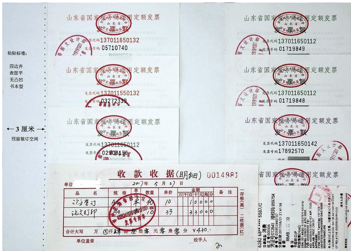
图 2-2 定额发票附明细