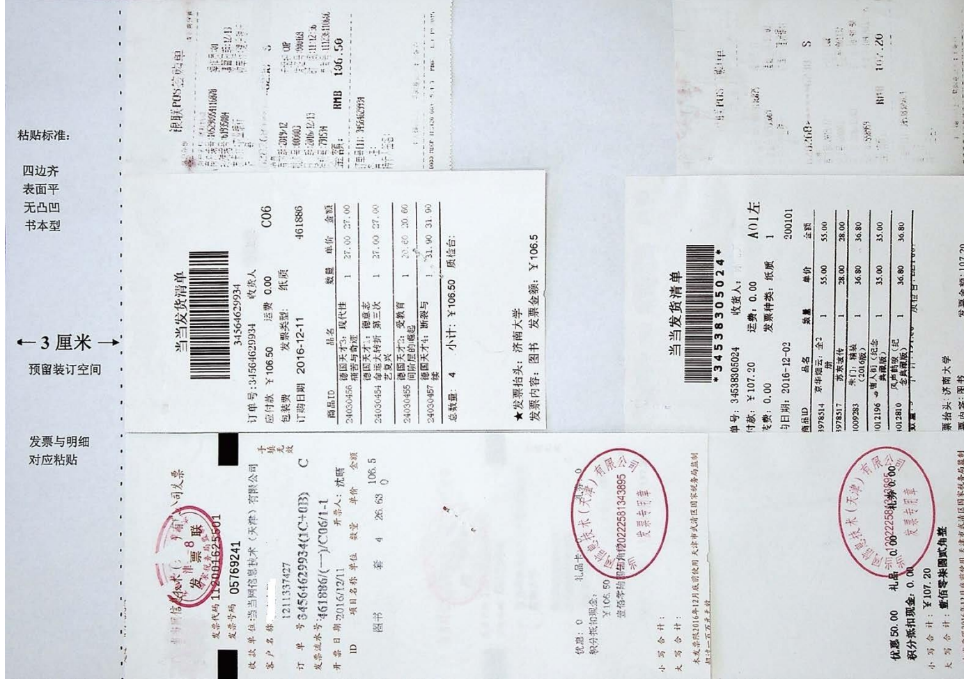
图 2-3 普通发票附明