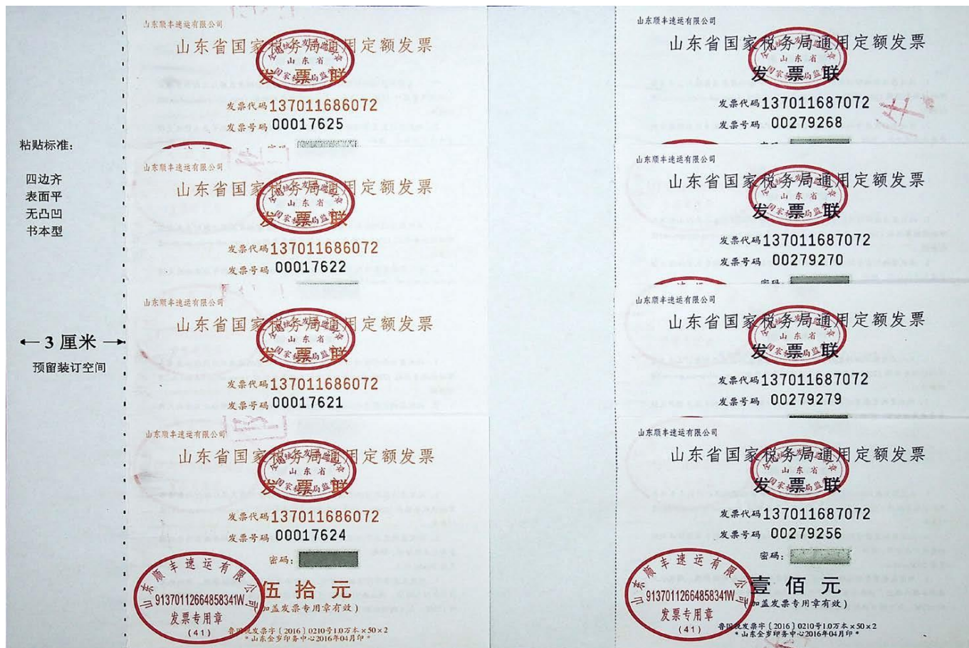
图 4-1 定额发票粘贴